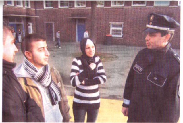
Polizeipresenz auf dem Schulhof – hier eine Szene aus Hamburg – ist eines der Mittel, Gewalt einzudämmen.

Schreiners Plädoyer für einen offenen Umgang mit Gewalt an Schulen