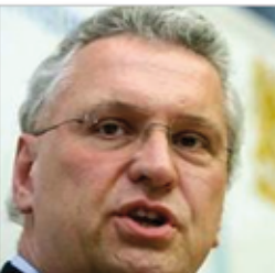
Joachim Herrmann: Ziel der Gesetzesänderung ist es, "eine beginnende Gewaltspirale von Anfang an zu stoppen"

Innenminister Herrmann fordert die rasche Ausweisung ausländischer Gewalttäter - und will einen Gesetzentwurf in den Bundesrat einbringen.